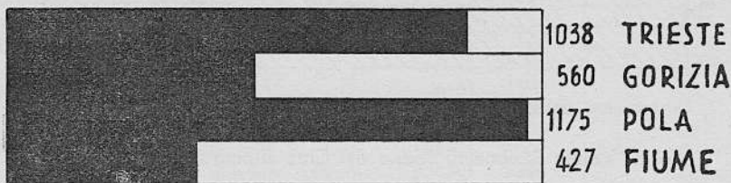
Proporzione delle grotte conosciute nelle quattro provincie della Venezia Giulia